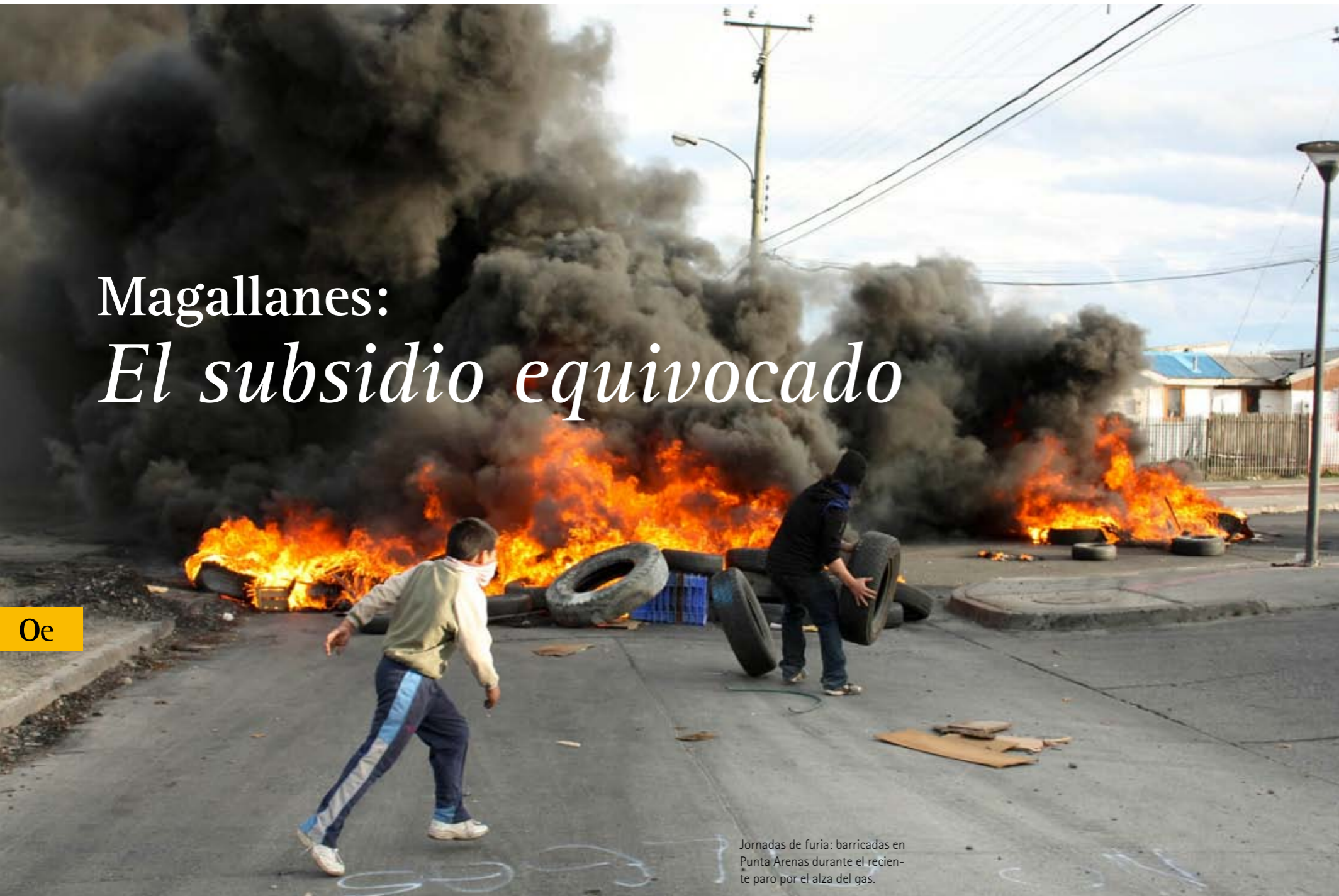
Jornadas de furia: barricadas en Punta Arenas durante el reciente paro por el alza del gas.

El subsidio al consumo de gas en la XII región, tan apreciado por los magallánicos, ha sido siempre una mala política, como lo es cualquiera que subsidie el precio de cualquier producto sin discriminación entre población adinerada y modesta, y sin topes razonables en la cantidad consumida. Pese a esto, las regiones extremas deben ser apoyadas con subsidios eficientes. Por Jorge Rodríguez Grossi*