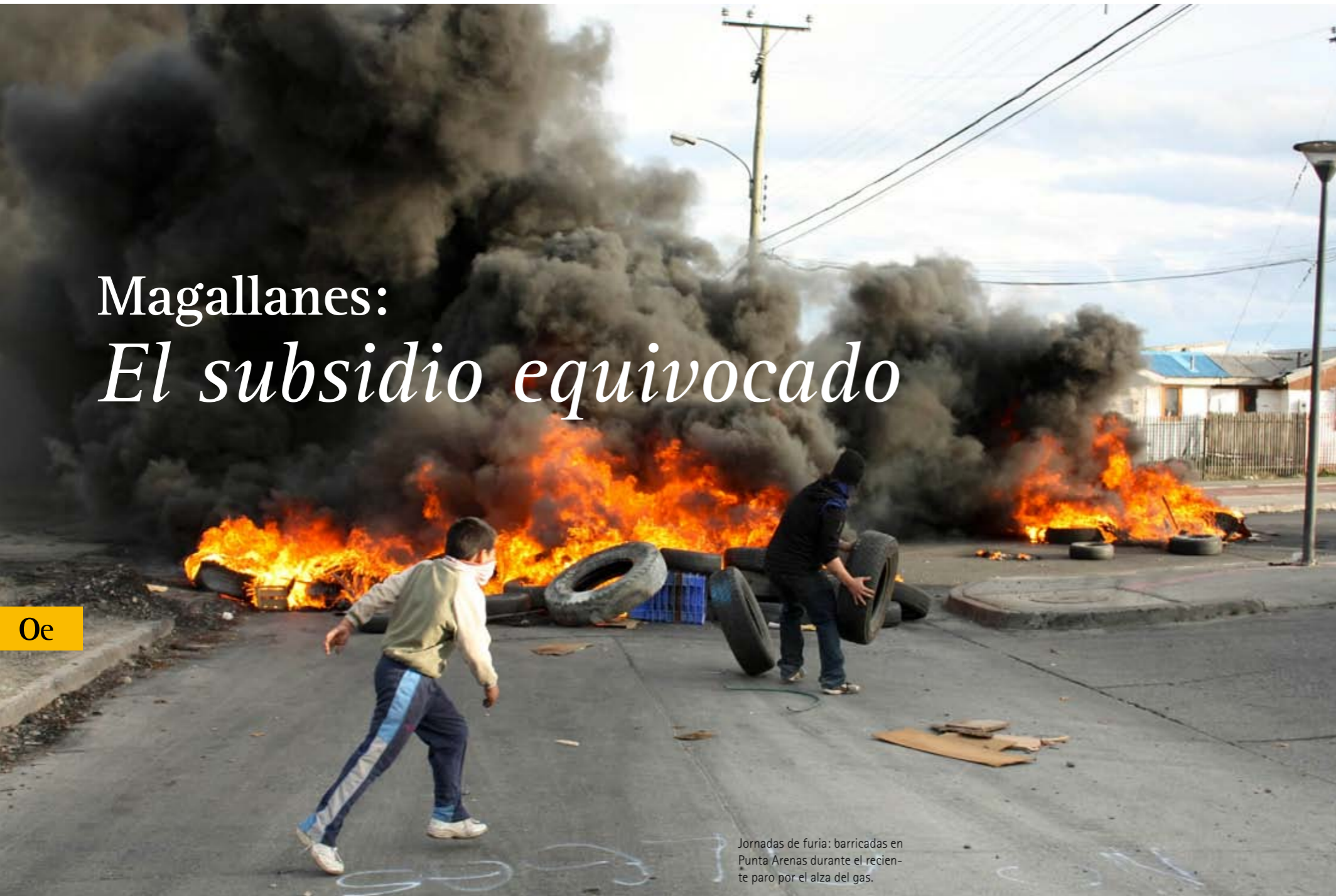
Jornadas de furia: barricadas en Punta Arenas durante el reciente paro por el alza del gas.

El subsidio al consumo de gas en la XII región, tan apreciado por los magallánicos, ha sido siempre una mala política, como lo es cualquiera que subsidie el precio de cualquier producto sin discriminación entre población adinerada y modesta, y sin topes razonables en la cantidad consumida. Pese a esto, las regiones extremas deben ser apoyadas con subsidios eficientes. Por Jorge Rodríguez Grossi*